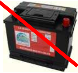
Batteries au plomb et à l'acide (batterie de voiture ou de moto)