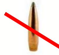
Cartouches ou douille de fusil