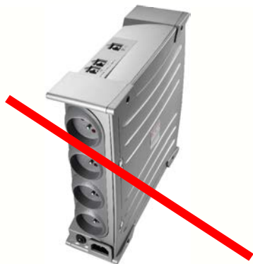
Onduleur (nous prenons uniquement la batterie)