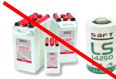
Piles et Batteries industrielles