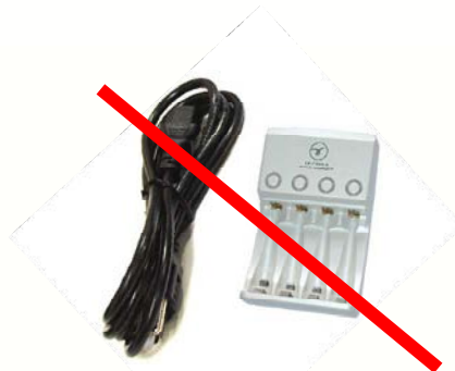
Chargeur pour pile rechargeables ou chargeur de batteries (A mettre avec les appareils électriques)