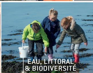
EAU, LITTORAL & BIODIVERSITÉ