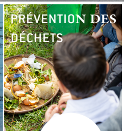
PRÉVENTION DES DÉCHETS

PROGRAMME DES ANIMATIONS SCOLAIRES 2023-2024