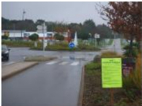
Les 5 chemins –

Projet de renouvellement de l'autorisation et d'extension de la station d'épuration de Kergroise Commune de Guidel – 16/12/2015