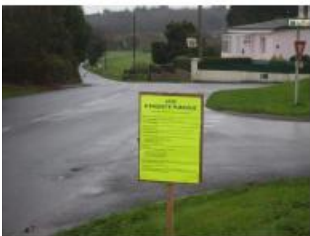
Kerrouarch – Direction Lorient