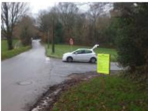
Route de la Déchetterie – carrefour de la station d'épuration –