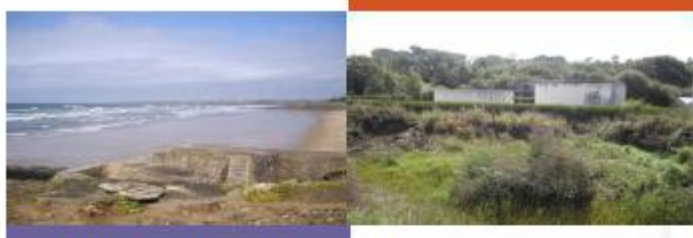
MEMOIRE EN REPOSE AU RAPPORT DU COMMISSAIRE ENQUETEUR