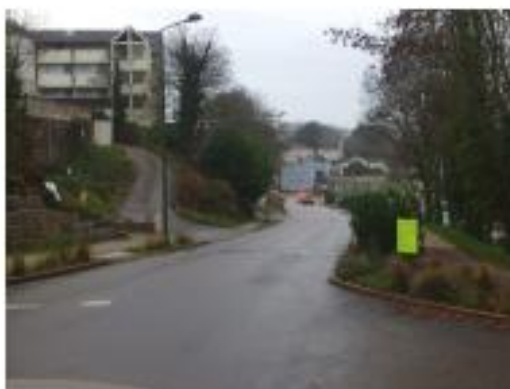
Guidel Plage – entrée par la RD 306