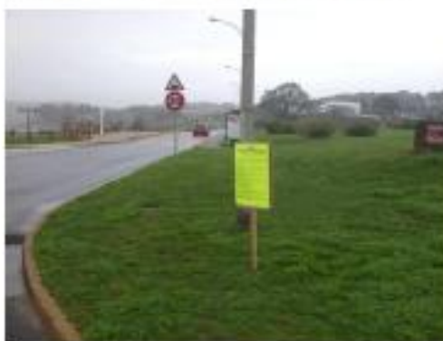
Guidel Plage – Parking des plages – RD 152