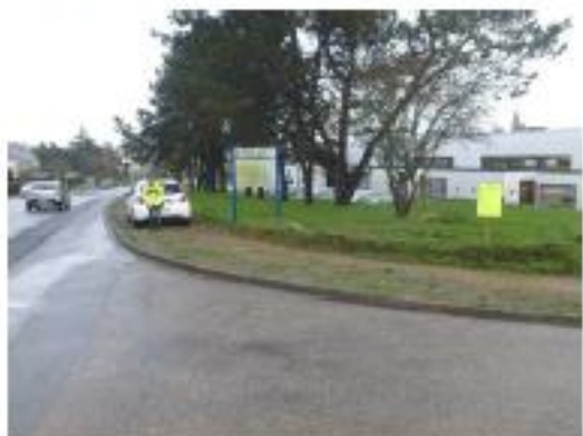
Place Le Montagner