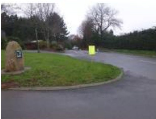
Kerrouarch – Direction Guidel Centre