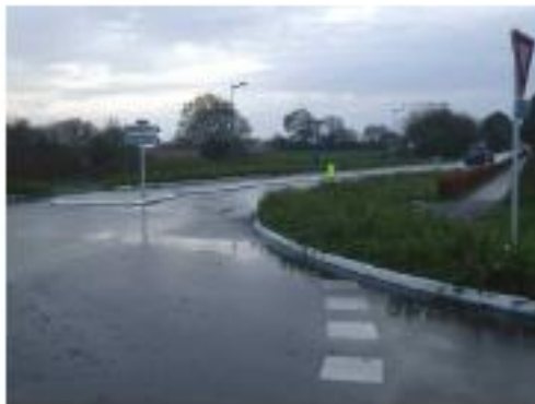
Rond Point de St Fiacre – Route de Guidel Plage