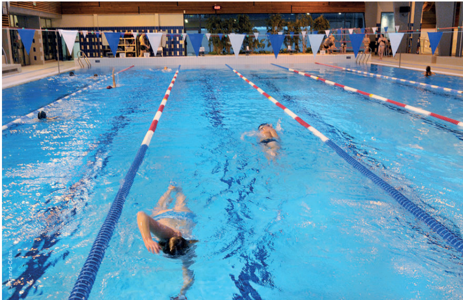
À Lorient, la chaufferie alimente de nombreux équipements dont la piscine du Moustoir

Lorient Agglomération, Quimperlé Communauté, la Ville de Lorient et quinze autres communes ont décidé de créer une société publique locale (SPL) afin de mettre en place une filière énergie bois.