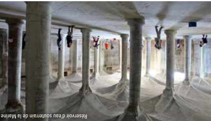
Réservoir d'eau souterrain de la Marine